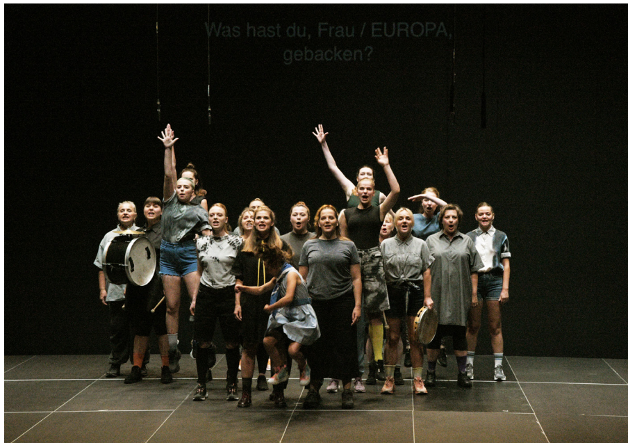
Der Chor der Frauen aus Marta Górnickas «Mo- thers. A Song for War- time»