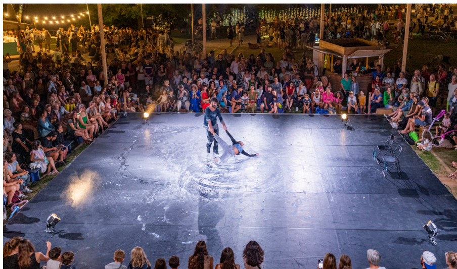
Begeisterte Zuschauer*innen bei der Companhia A Tope am Zentral