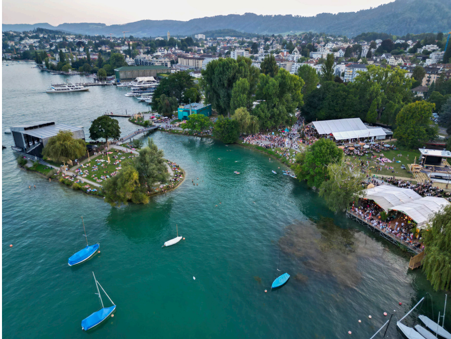
Das Zürcher Theater Spektakel auf der Landiwiese aus der Vogelperspektive

18 magische Festivaltage und -nächte, in denen gestaunt, applaudiert, gelacht, nachgedacht, diskutiert, geschwitzt, gebadet und gefeiert wurde: Das 45. Zürcher Theater Spektakel war in vielerlei Hinsicht ein grosser Erfolg, künstlerisch, atmosphärisch, emotional – und auch im Publikumszuspruch.