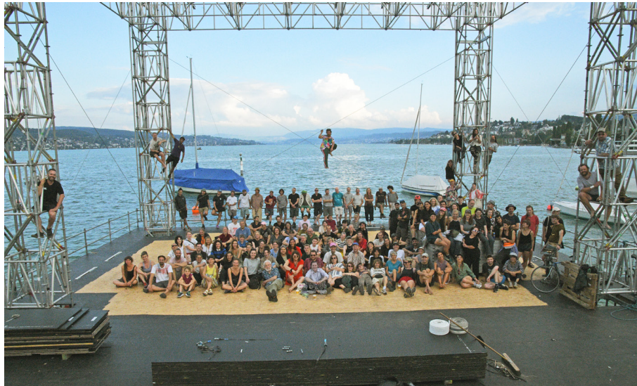
Die Mitarbeitenden des Zürcher Theater Spektakels 2024.