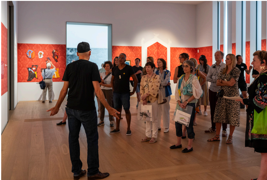
Walid Raad beim performativen Walk durch seine Ausstellung im Kunsthaus Zürich