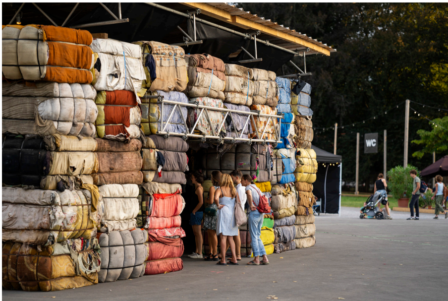
Im Inneren der begehbaren Installation aus Altkleider- ballen wird ein Film gezeigt

Eines der meistbeachteten und -diskutierten Projekte war sicher die Performance des belgischen Kollektivs Captain Boomer , die einen lebensgrossen Pottwal am Utoquai stranden liessen. Über Nacht wurde der Wal nicht nur in Zürich zum «Stadtgespräch» (SRF Regionaljournal) und Instagram-Hit. Er schaffte es auch überregional auf unzählige Titelseiten und regte gleichermaßen zu wunderbaren Mutmassungen an – wie zu tiefgreifenden Gesprächen über Umweltfragen, den Fischfang und unsere Verantwortung für Natur und die Meere.