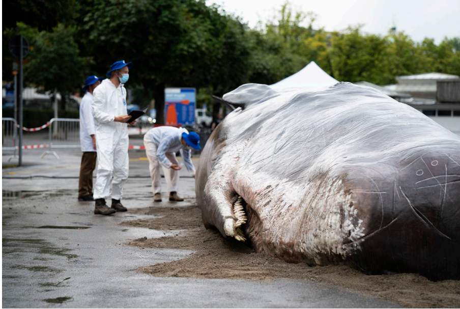
Ein lebensgrosser Pottwal ist am Utoquai gestrandet